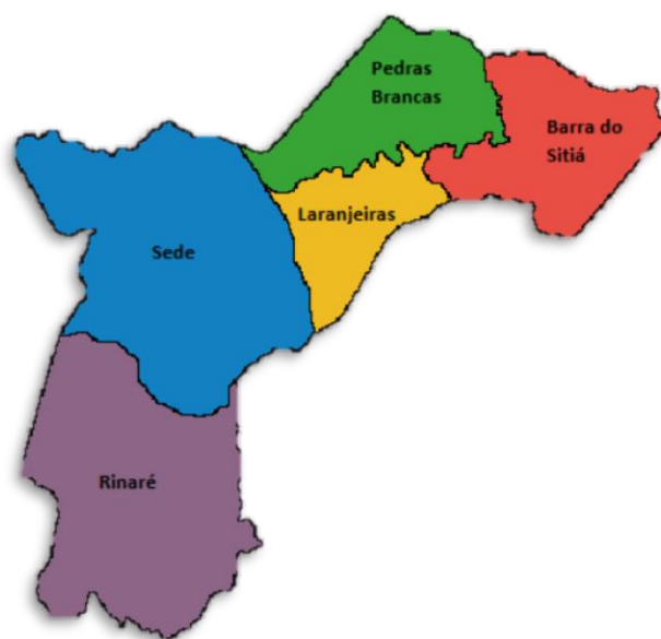
Figura 2 - Geograficamente, faz limite ao norte com Quixadá, Morada Nova ao leste, Quixeramobim a oeste, Jaguaretama e Solonópole ao sul.